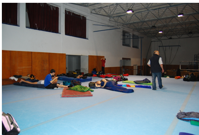
Obrázek 2. Přespaní v gymnastické tělocvičně v Ostravě z pátku na sobotu před závodem

Hlavní soutěž pro nás začala v odpoledních hodinách. Začínali jsme opět na tumblingu. Atmosféra byla výborná. V době, kdy jsme cvičili nebyl, kromě rozhodčích, na ploše nikdo a