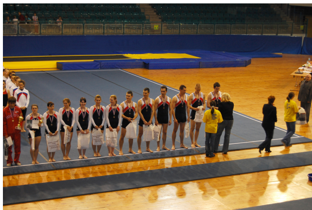
Obrázek 3. Vyhlášení výsledků. TJ Sokol Příbram 3.místo.