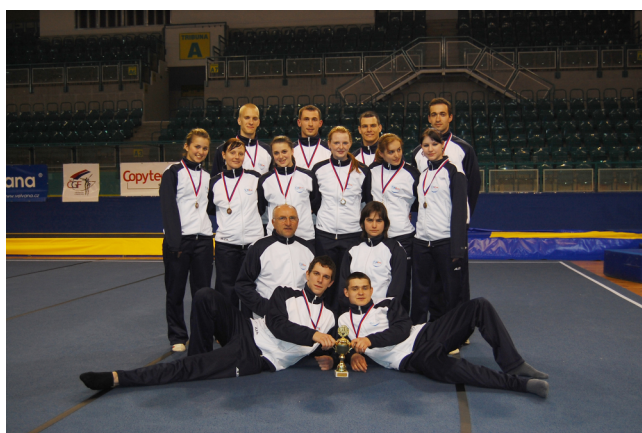
Obrázek 4. Společné fotografování po vyhlášení výsledků.

Závod pro nás již skončil, a proto jsme usazeni v hledišti pozorovali ostatní závodníky. Sportovní úroveň byla vysoká snad i díky účasti několika reprezentantů ve sportovní gymnastice v jednotlivých týmech. Každého z nás začalo zajímat výsledné hodnocení naše, i ostatních. Snažili jsme se kalkulovat a odhadovat kolikátí dopadneme. Na ME postupují první dvě česká družstva. Favorité soutěže, gymnasté z Vítkovic, byli nepochybnitelní. Zbývalo tedy vybojovat další příčku. Informace o našem hodnocení nebo dokonce o hodnocení ostatních byly neúplné. S napětím jsme tedy čekali na konečné vyhodnocení výsledků.